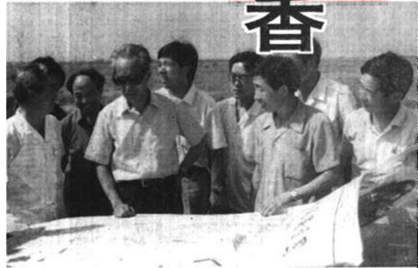
1990年，国家计委领导在垦利县水稻农场视察

长曾志，原山东省委书记姜春云和原省长赵志浩等领导都先后来到这开发工地检查指导工作。按照“一出发效，二出经验”的要求，全县干部群众奋战一冬春，完成了6万亩稻田的骨干工程和2万亩开发面积的配套工程，建成了引水可靠，蓄水充足，灌排畅通的水利体系。达到了引、蓄、灌、排、沟、渠、路、林全面配套。1990年插秧2万亩，平均亩产稻谷400公斤。这方热土以丰硕的成果给垦利人民以回报。国家计委、山东农业大学的专家、教授们在考查验收时，感慨地说：“在这大面积的荒碱地上改碱种稻，一举成功，不能不说是一个奇迹。”1991年，垦利县水稻农场开发种植水稻面积达到4万亩以上。至此，垦利县水稻农场真正树立了规模化、标准化、系列化水稻生产示范样板，为开发黄河三角洲的农业闯出了一条新路子。真正达到了“一出发效，二出经验”的要求。实现了开发一片，成功一片的目标。